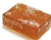
mýdlo = dívka 5/5