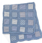
deka = smrad 2/5