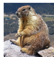
svišť = dítě 2/4