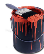
barva = prd 3/3