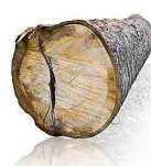
kláda = třída 1/5