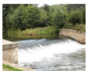
splav = žízeň 4/5