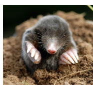
krtek = metro 5/5