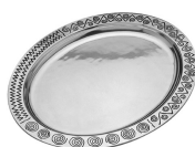
tác = tisíc 2/5