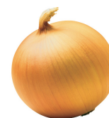
cibule = hodinky 5/7