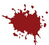
flek = místo 1/5