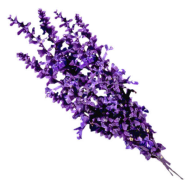
levandula = špatné 1/6