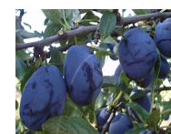
švestky = policie 4/7