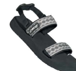
sandál = obličej 2/7