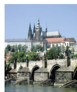
hradčany = stokoruna 2/9