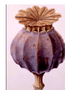
makovice = hlava 2/5