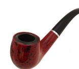
fajfka = noha 4/4