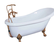
vana = břicho 2/6