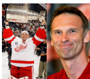
hašek = hašiš 5/5